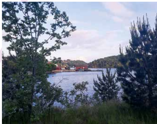
Der Schärengarten Norwegens

Da ich in einer kleinen Stadt lebe, nehme ich es als herausfordernd wahr, Kontakte zu Gleichaltrigen herzustellen, in größeren Städten oder als Austauschschülerin/-studentin ist dies vermutlich einfacher.