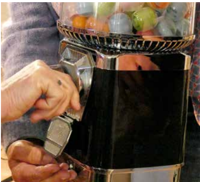
Früher hipp, heute topp, der Kaugummiautomat, der sprechen kann

Für Herrn B. war es besonders, sich durch den Kaugummiautomaten mit Konflikten zu beschäftigen. Beispielsweise wurde er angeregt, doch mal Vorwürfe in Wünsche zu verwandeln. Er kam zwar ohne Begleitung zur Wohnzimmerkirche, genoss die Atmosphäre aber und kam schnell ins Gespräch mit weiteren Besucher:innen.