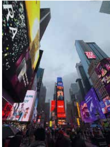
Der Times Square in New York

Natürlich gibt es auch Herausforderungen – am Anfang war es nicht immer leicht, mich an die Sprache und die neue Umgebung zu gewöhnen, und manchmal wünscht man sich auch mal wieder seine Familie und Freunde bei sich zu haben. Die schönen Erlebnisse überwiegen aber auf jeden Fall! Lustige Gespräche mit meinen Gasteltern oder Geschwistern, das Gefühl zu haben, ein Teil einer Freundesgruppe zu sein, und Aktivitäten wie Flag Football zu spielen und in den amerikanischen Supermarkt zu gehen – all das sind wunderschöne Erfahrungen, die ich schon machen durfte.