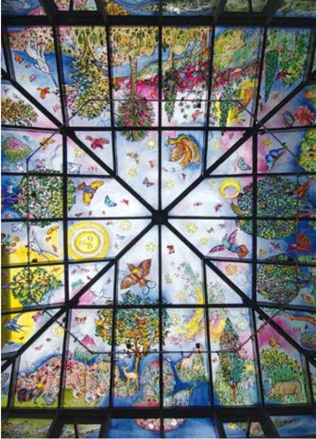
Die Glasdecke in der Krankenhauskapelle in Bethel