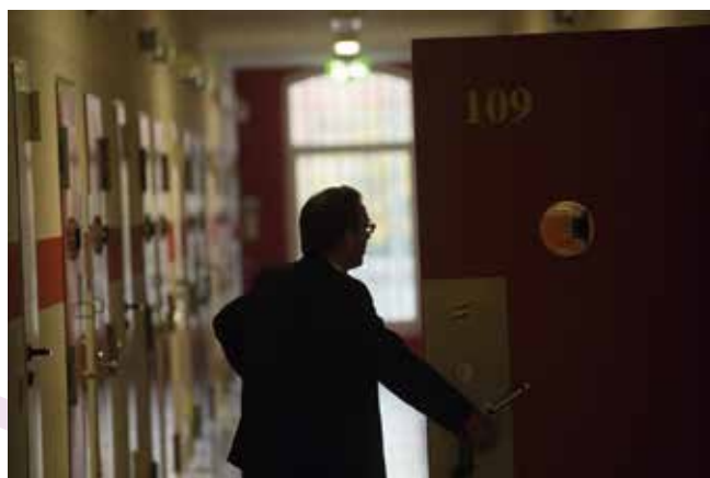
Im Dialog mit Gott und der Welt

Es wird erzählt, dass die letzten beiden Gesichter, die Leonardo da Vinci an seinem Wandgemälde vom letzten Abendmahl noch ausmalen musste, die von Jesus und Judas gewesen seien. Weil unter den Mönchen des Dominikanerklosters Santa Maria delle Grazie in Mailand niemand weder für den Sohn Gottes noch für seinen Verräter Modell stehen wollte, wurde die Suche auf ganz Mailand ausgedehnt. Die Legende erzählt, dass da Vinci an einem Fluss auf einen Fährmann traf mit einem wunderschönen, ebenmäßigen Gesicht. So fehlte nur noch das Gesicht des Judas, dem, wie es heißt, die Bosheit des Verrats im Gesicht stehen sollte. Nach Jahren der Suche wurde da Vinci auch dafür fündig.