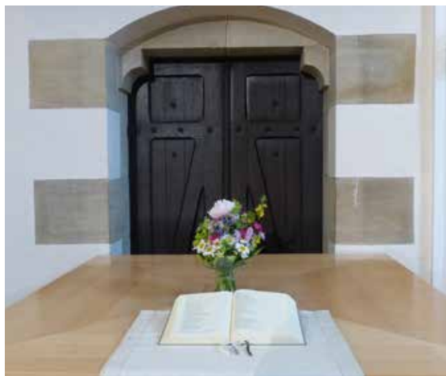
Der Tisch des Herrn in unserer Kirche

Es gibt keinen Altar wie bei Lutheraner*innen, sondern einen Abendmahlstisch, auf dem auch mal das Kuchenbüffet steht.