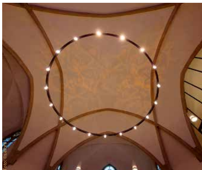
Beleuchtetes Deckengewölbe in der Petrikirche

Überhaupt muss der Gottesdienst auch nicht in der Kirche stattfinden, wenn auf der Wiese davor gerade die Sonne scheint oder der Tierpark geöffnet hat.