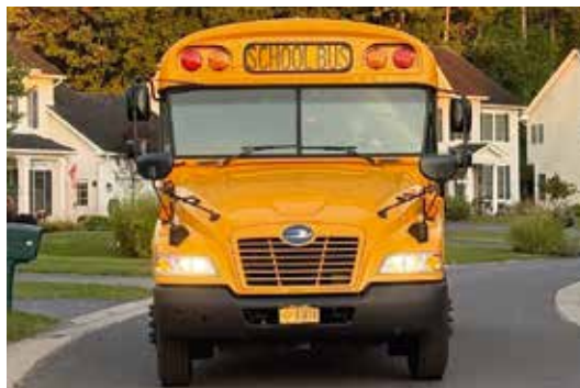
Mit dem Bus zur Highschool

Es ist auf jeden Fall anders, ich habe hier zwei kleine Gastgeschwister (6 und 3 Jahre alt), die beiden verändern auf jeden Fall einiges, da ich in Deutschland ein Einzelkind bin. Außerdem spiele ich gerade Lacrosse, das bedeutet: jeden Tag zwei Stunden Training, bis auf Sonntag, und regelmäßige Spiele zuhause oder in einer anderen Stadt. Das ist im Vergleich zu Deutschland ebenfalls ein großer Unterschied, denn dort trainiere ich einmal wöchentlich für zwei Stunden.